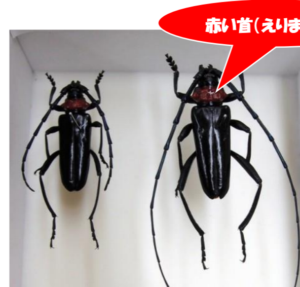
赤い首(えいまき状)