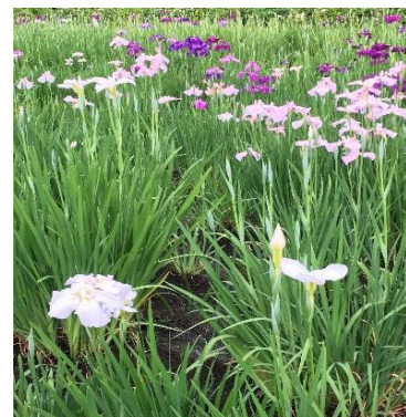
あげお花しょうぶ祭り 6/1~6/13