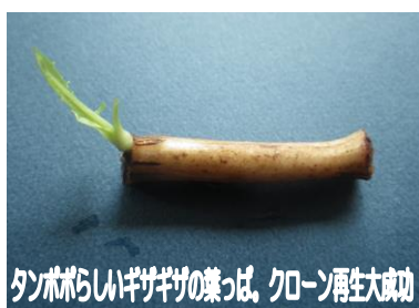
タンポポらしいギザギザの葉っぱ、クローン再生大成功！