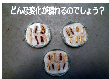
どんな変化が現れるのでしょうか？

それだけではありません。なんとこの根っこ、チョキンと切られてもへっちゃら。下の写真をご覧ください。