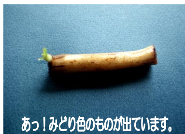
あっ！みどり色のものが出ています。