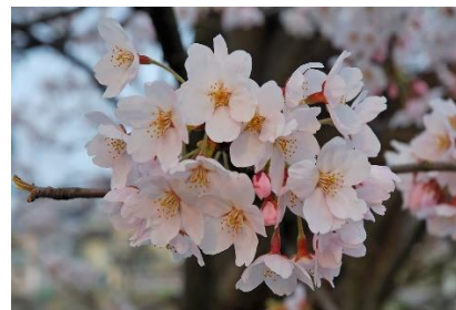
上尾さくらまつり