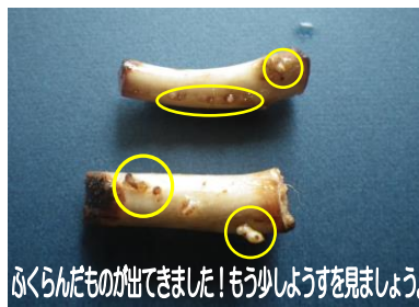
ふくらんだものが出てきました！もう少し様子を見ましょう。