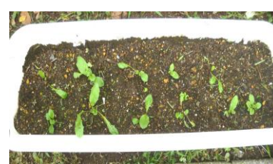
24本中15本の根が再生しました。

3cm位に切った根を水にひたしておくと、ところどころぷくっとふくれて、やがてタンポポ特有のギザギザの葉が……。つまり、根をすべて掘り取らないかぎりその場で生き続けるだけでなく、切り離された根も再生し、元の株の分身として成長できるのです。これぞタンポポのクローン！ポポクローンですね。