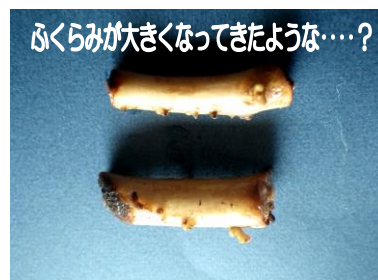
ふくらみが大きくなってきたような…？